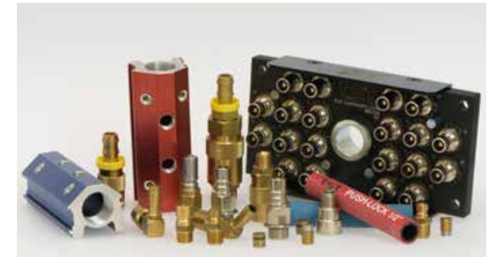
RACCORDI PER CONDIZIONAMENTO STAMPI