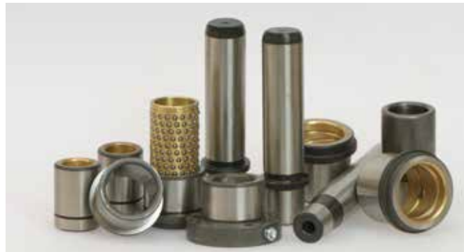
ELEMENTI DI GUIDA DI ALTA QUALITA' SECONDO NORMA ISO ED A DISEGNO