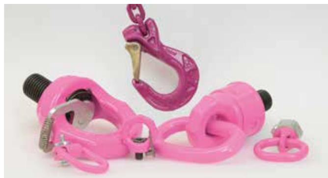
PUNTI DI SICUREZZA