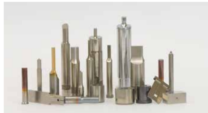
PUNZONI E MATRICI