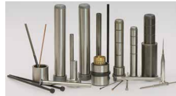
ELEMENTI DI GUIDA E DI ESPULSIONE